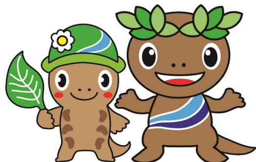
森っこサンちゃん